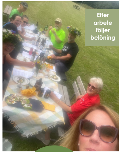
Efter arbete följer belöning