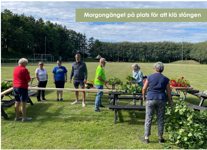
Morgongänget på plats för att klä stängen