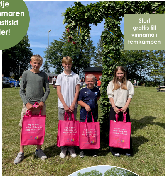
Stort grattis till vinnarna i femkampen